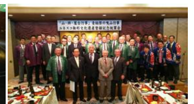
世界無形文化遺産祝賀会