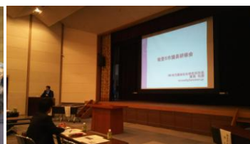
能登五市議会研修会