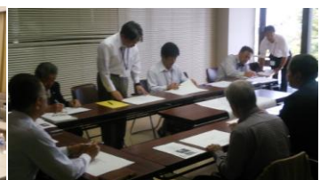
松原・杵田川調査報告