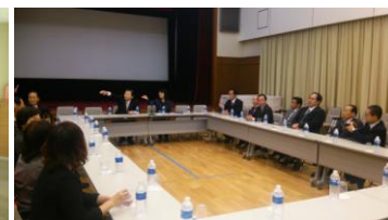
大使館で意見交換