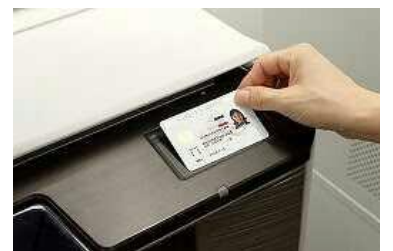
コンビニのコピー機を活用した行政サービス。

不嶋市長は実施の必要性は認めたものの、コストを抑えるために来年実施の マイナンバー制度への市民加入が必要 と答弁。情報管理・流出対策を進めて、市民の理解を。