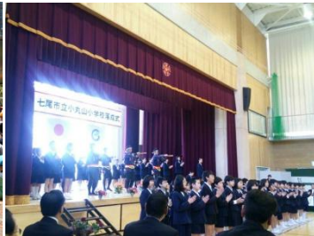
小丸山小学校落成式