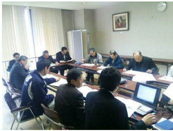
地域への政策説明