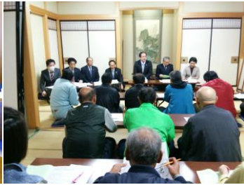
市民と議会との懇談会