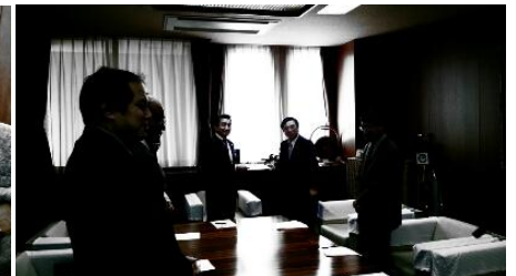
地域課題を市長へ要請