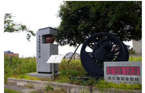
整備を求めた旧七尾港駅跡地

また、七尾港矢田新県有地の開発や、旧七尾港駅の「鉄道公園」整備を提案。実現に向けて、地域の声をしっかりと受け止めて突き進んでいきます。