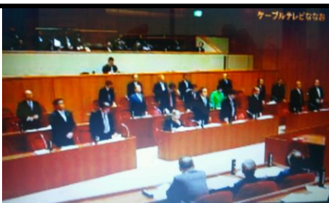
本会議で意見書採決 (CATV ななお)

山間地の唯一の金融機関である 郵便局を支援し、地域を守るため 提出した「 郵政サービスの維持・ 確保を求める意見書 」が 19対1 の 賛成多数で可決。市議会から国へ 「 地域を守る戦い 」を訴えます！