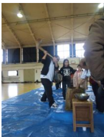
(左) 子ども会もちつき大会 (中) Xmasパーティ (右) 柔道鏡開き

11月に招集された臨時議会において、税金・地域対策などを担当する「 総務企画常任副委員長 」に再任されるとともに、環境・エネルギーを担当する「 環境問題対策特別委員長 」、議会運営を決定する「 議会運営委員 」に選出されました。議会改革を実現するため、全力で取り組みます。