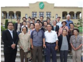
地域の皆さんとバス見学

国・県にエネルギー安定供給を重視した「責任ある」体制づくりを求め、 安心・安全と地域発展を目指し、地元企業との連携を改めて市長に要求。 市議会で地域が中心の「自主防災組織」予算の追加増額を実現。