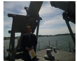
(七尾港に停泊した海自艇「はやぶさ」)

Q. 七尾港の 物流・水産拠点 に加えて 船舶の中継拠点としての位置づけ を検討してはどうか? 例えば県内随一の七尾の造船業を活用した民間船舶や巡視艇のドッグ事業や日本海が荒れたときに低額係留地の整備をすべきでは?